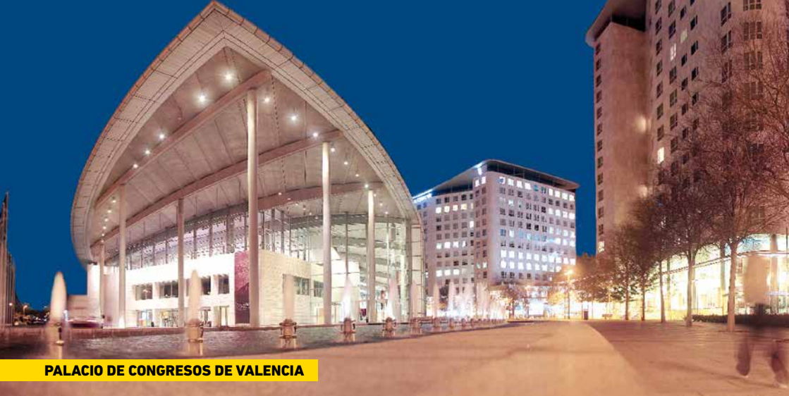
PALACIO DE CONGRESOS DE VALENCIA