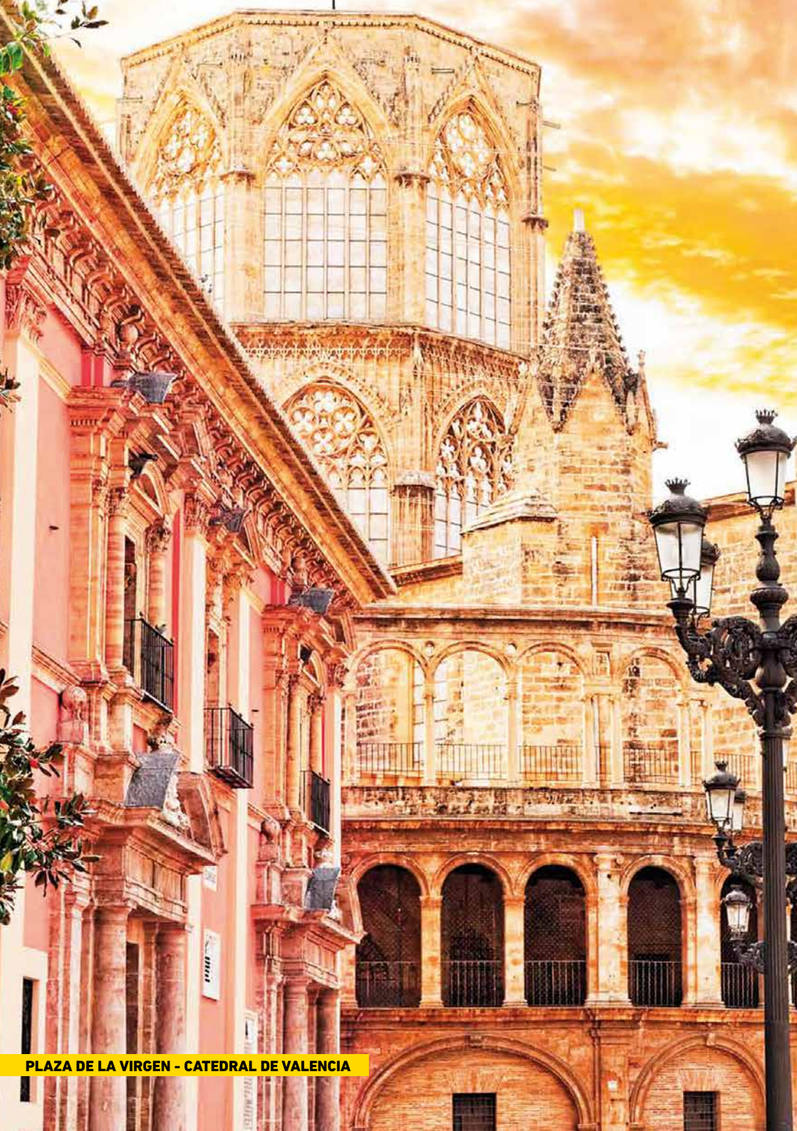
PLAZA DE LA VIRGEN - CATEDRAL DE VALENCIA